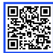
숙명여자대학교 특수대학원 홈페이지